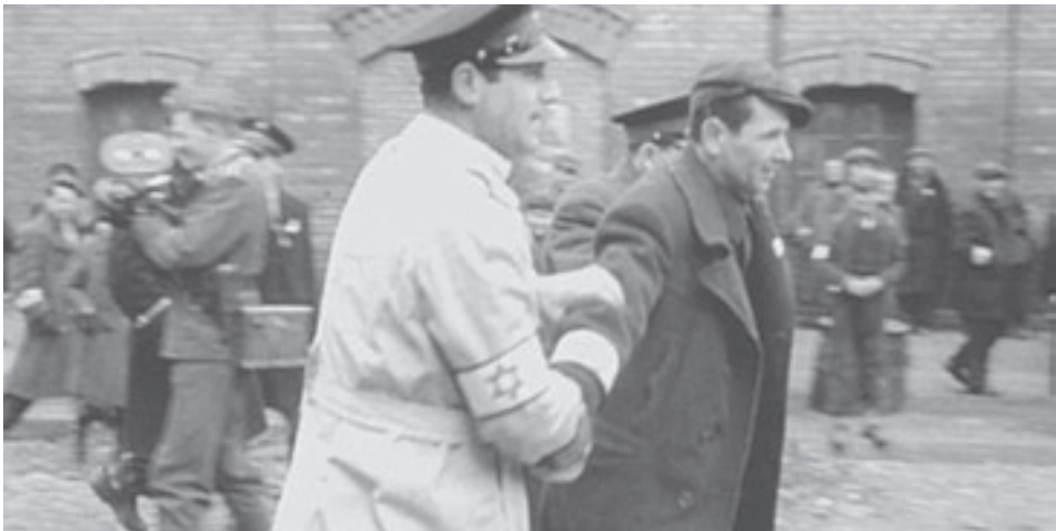
Кадр из «Неоконченного фильма» Яэль Херсонски

трупы из своих квартир на тротуар у подъезда. Смотря немецкую ленту, начинаешь ощущать, что это выглядит уже нормой: люди идут мимо, перешагивая через мертвых, словно не замечают их, будто это привычное дело - лежащее тело, за которым рано или поздно придут двое с тележкой. Потом по длинному желобу трупы сваливают в одну большую яму. Камера бесстрастно наблюдает за этим процессом. Уже сложившееся отношение к